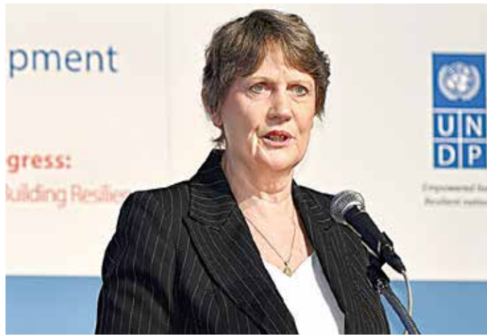
Helen Clark, administradora del Programa de Naciones Unidas para el Desarrollo, fue quien presentó en Tokio el informe sobre la pobreza.

Este indicador de pobreza del PNUD se elabora cruzando datos sobre mortalidad infantil,