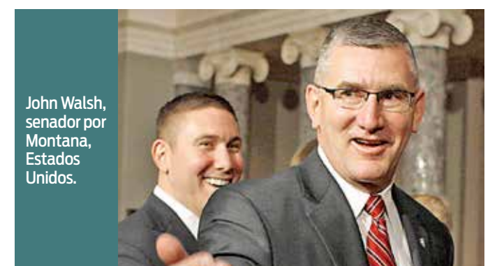
John Walsh, senador por Montana, Estados Unidos.

El rotativo destacó que este nuevo escándalo puede afectar severamente a la popularidad de Walsh, quien es partícipe de los debates sobre temas tan importantes como la regulación de las drogas en Estados Unidos.