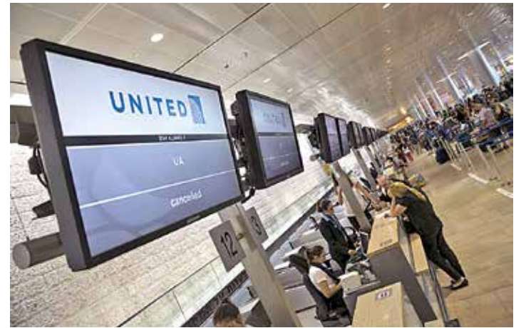
Pasajeros esperan por vuelos en el aeropuerto Ben Gurion de Tel Aviv.