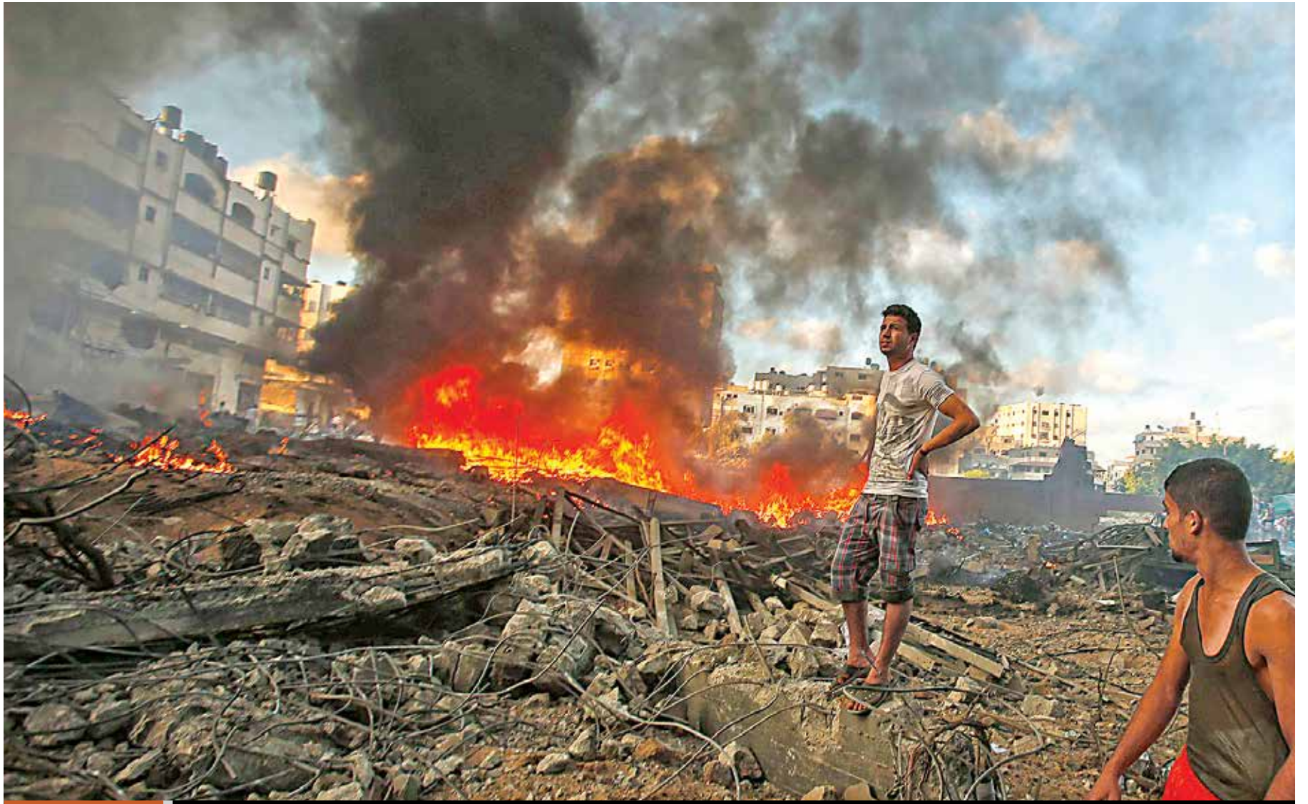
ATAQUES EN LA CIUDAD DE GAZA Palestinos observan los daños provocados por un ataque aéreo israelí contra un edificio de la ciudad de Gaza. Desde el inicio de la operación Barrera Protectora el pasado 8 de julio han muerto más de 800 palestinos y otros mil han resultado heridos, según informaron autoridades de la Franja de Gaza.

"Tenemos mucho trabajo que hacer. Ciertamente tengo mucho