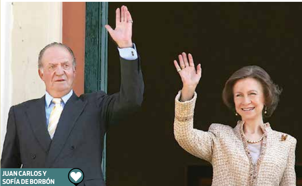
JUAN CARLOS Y SOFÍA DE BORBÓN

Gobernantes y políticos de diferentes países llegaron a este Día del Amor y la Amistad reforzando su relación o inmersos en el escándalo de amoríos o crisis matrimoniales