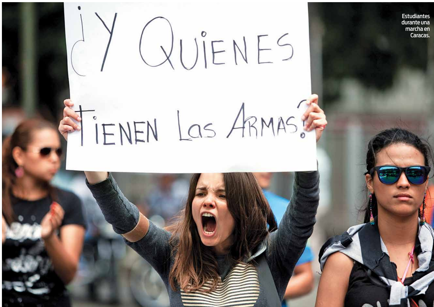
Estudiantes durante una marcha en Caracas.

JOSÉ MIGUEL INSULZA SECRETARIO DE LA OEA