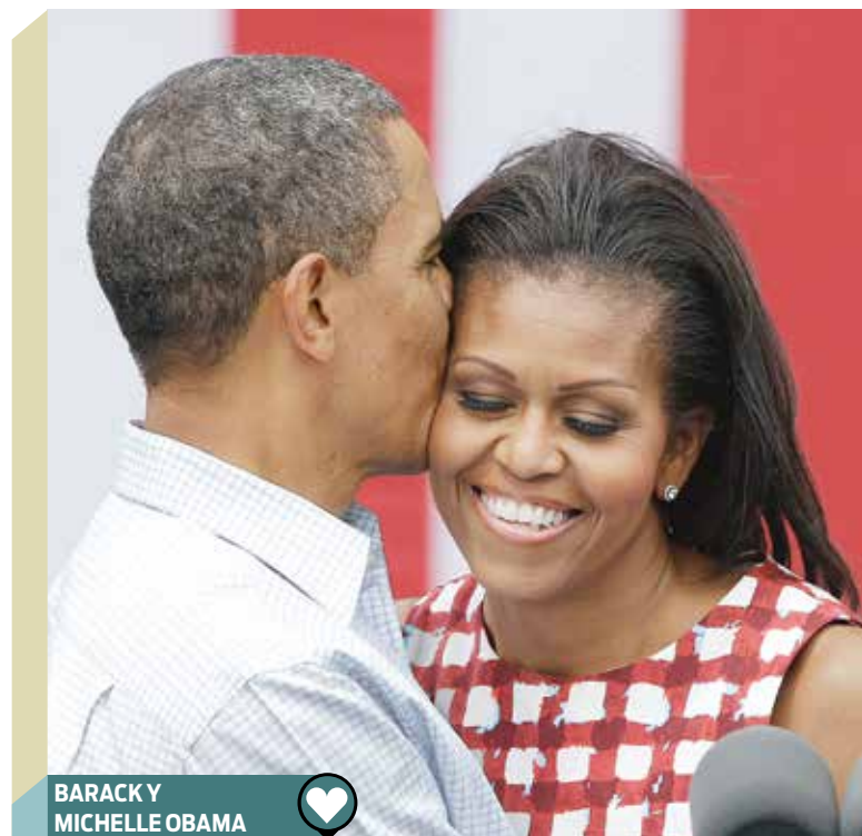
BARACK Y MICHELLE OBAMA

Tampoco es posible dejar de citar a la presidenta Cristina