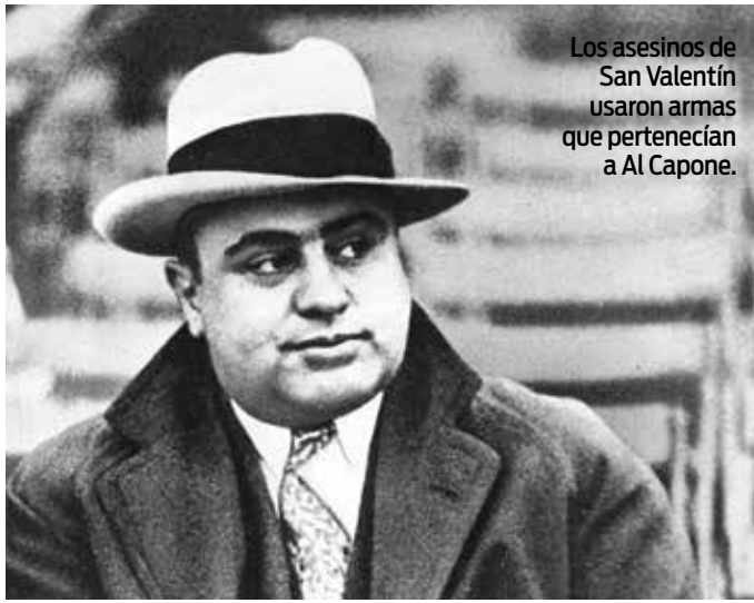
Los asesinos de San Valentín usaron armas que pertenecían a Al Capone.