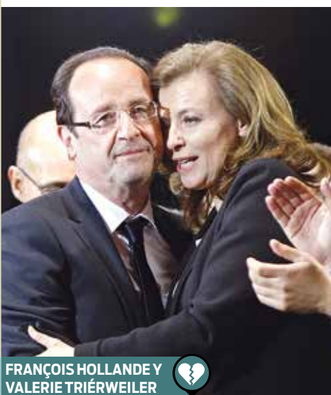
FRANÇOIS HOLLANDE Y VALERIE TRIERWEILER