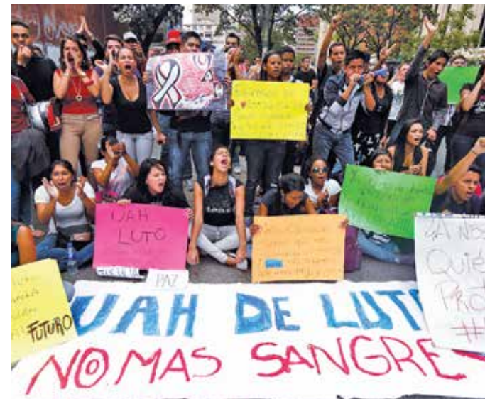
Jóvenes opositores al gobierno de Nicolás Maduro marcharon en Caracas para repudiar las agresiones que sufrieron el miércoles.

El plan El ministro del Interior dijo que el plan de la extrema derecha es provocar una guerra civil en Venezuela para derrocar al chavismo.