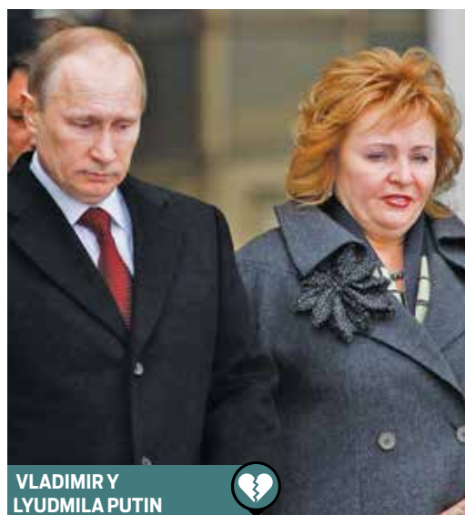
VLADIMIR Y LYUDMILA PUTIN