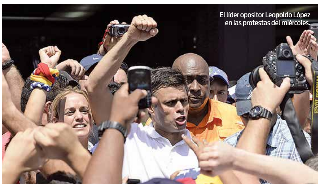
El líder opositor Leopoldo López en las protestas del miércoles.

La protesta también exigiría que se restituya la libertad de expresión de los medios de comunicación venezolanos, pues se les impuso una “férrea censura y no están informando nada”.