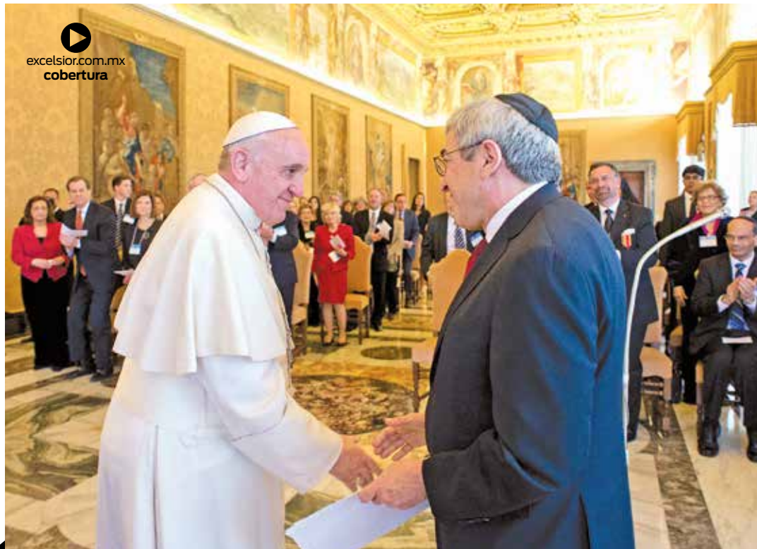
REUNIONES DE TRABAJO

Una iniciativa que partió como simbólica y que ha superado todas las expectativas en cuanto a participación.